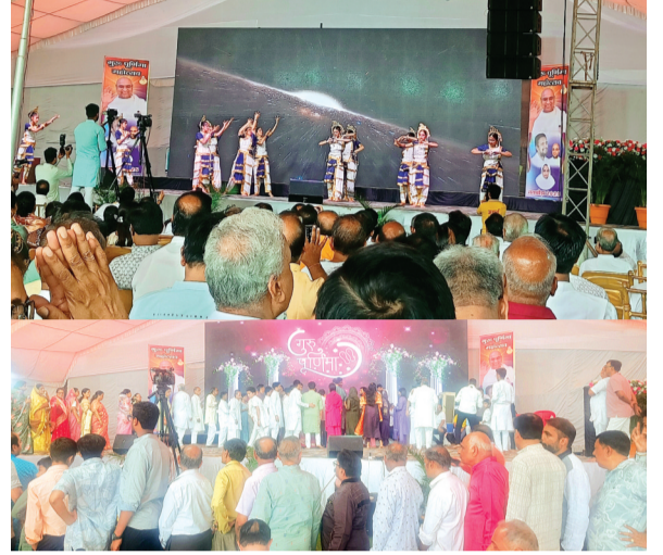
हरिभूमि न्यूज | नलखेड़ा