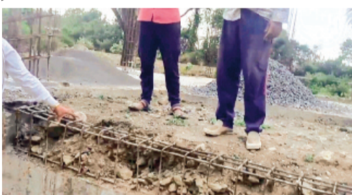
लगाया गया सरिया भी 16 की जगह 12 एएमएम का उपयोग किया गया है, साथ ही ईंट की

ब्यावरा। लखनवास में निर्माणाधीन प्राथमिक स्वास्थ्य केंद्र की बिल्डिंग पर ग्रामीणों द्वारा गुणवत्ताहीन निर्माण को लेकर लगातार आरोप लग रहे हैं। यदि वहां पर काम कर रहे मिस्त्री की बात को सही माने तो उसका कहना है कि बिल्डिंग के पुटिंग जाल, कॉलम में लगी रिंग और ईंट को लेकर काम ड्राइंग के मानकों के हिसाब ने नहीं हो रहा है। बताया गया कि पुटिंग जाल में आधे से कम सरिया लगाया गया है और कॉलम में रिंग 4 व 6 इंच पर होना चाहिए तो वह 8 से 9 इंच की दूरी पर लगाए गए हैं। वहीं पिलिंथ के वीम में