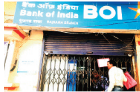
हरिभूमि न्यूज ▶▶ राजगढ़