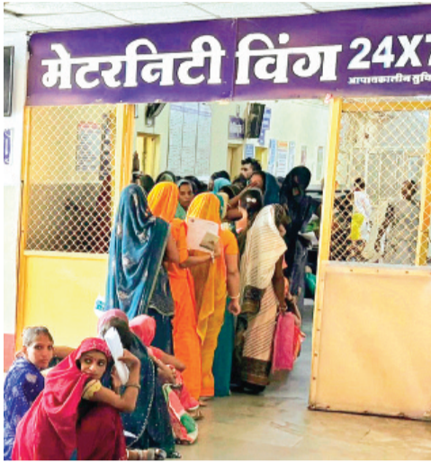
बैठने के लिए भी नहीं थी उचित व्यवस्थाएं